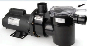
Nova série de bombas com novo sistema de fechamento do pré-filtro